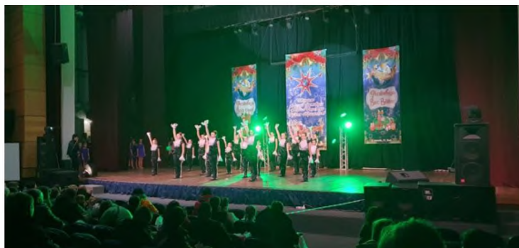
Під час новорічних свят в будинку культури

потреби населення, проводячи майстер-класи, різноманітні тематичні вечори, ігрові програми, в літній час працює кінотеатр під відкритим небом. Життя Будинку культури – це постійний пошук нових форм роботи, цікавих засобів втілення задуманого, намагання залучити до участі в колективах все нових і нових учасників.