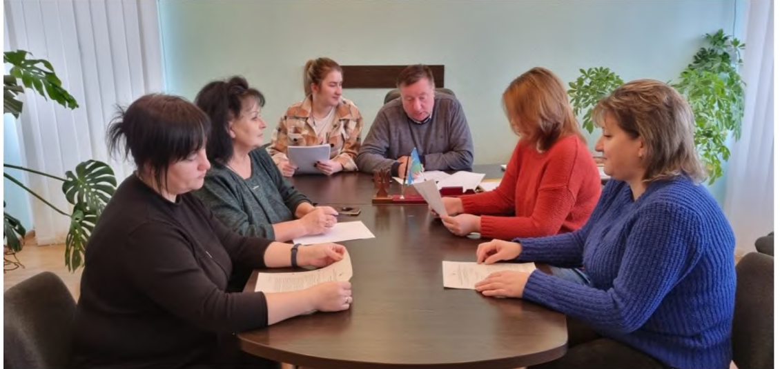
Під час засідання «круглого столу» в рамках Всеукраїнської акції «16 днів проти насильства»

Соціальні послуги на території Олександрівського старостинського округу надають фахівець із соціальної роботи II категорії, соціальний працівник та соціальні робітники. В першу чергу, послугами охоплені вразливі верстви населення та самотні особи похилого віку, які потребують догляду вдома. Одним із видів соціальної роботи є надання гуманітарної допомоги. Особливо актуальним це питання стало після оголошення воєнного стану на всій території нашої країни та початком переміщення осіб в межах держави. Під час роботи з сім'ями, які потребують особливої соціальної підтримки, досить часто виникає потреба у екстремому наданні найнеобхідніших речей, де я надаю безпосередню гуманітарну допомогу.