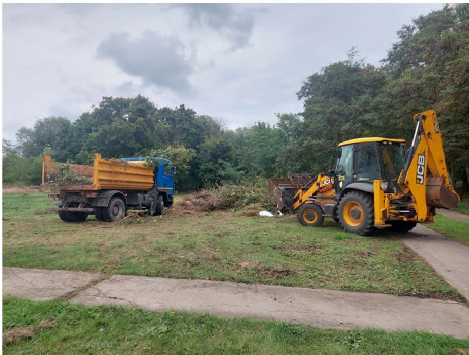
Вивіз сміття з парку ім. Комарова після толоки

Хочу подякувати за довіру, за підтримку і співпрацю керівництву територіальної громади, депутатам, жителям округу, які підтримували і підтримують мене, дають поради, тим, хто не просто критикує, а вносить пропозиції з покращення життя громади.