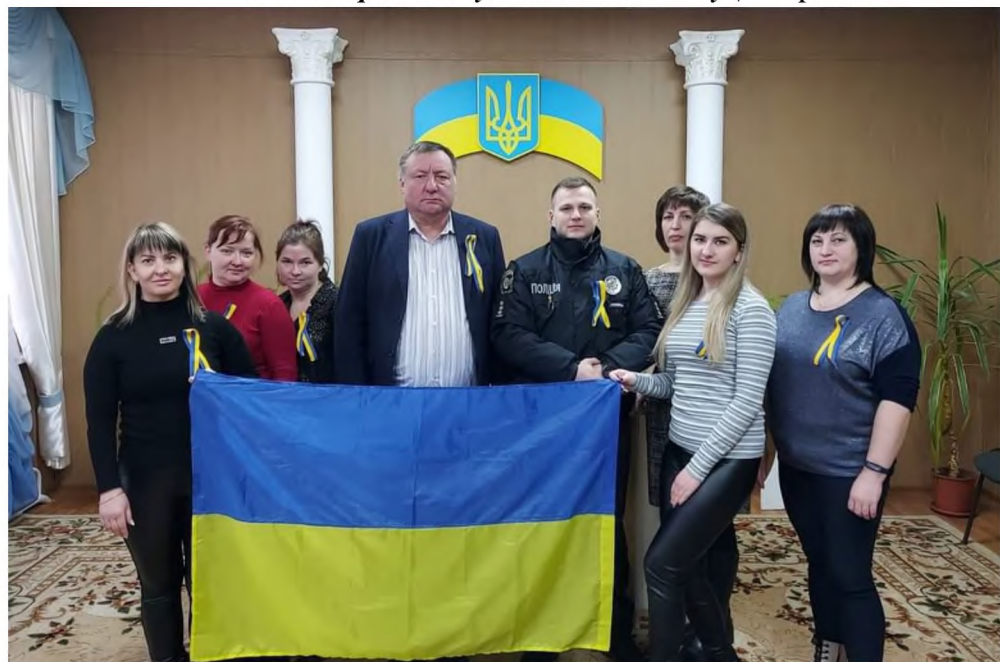
Під час флешмоду до «Дня єдності»

Осередками культурного розвитку на території Олександрівського старостинського округу є Бібліотека та будинок культури с. Олександрівка КЗ «ЦКД Слобожанський» ССР.