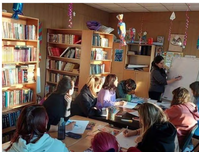
Під час тренінгу в бібліотеці

У 2022 році робота бібліотеки була направлена на просвіту, збереження культурної спадщини, відповідальність відносно проблеми читання, підтримку і розвиток читацької культури, загальнодоступність та безкоштовність основних бібліотечних послуг.