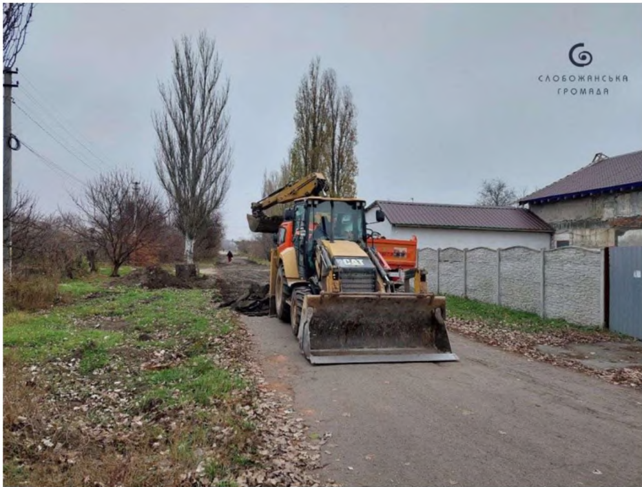
Під час ремонту по вул. Доновського.