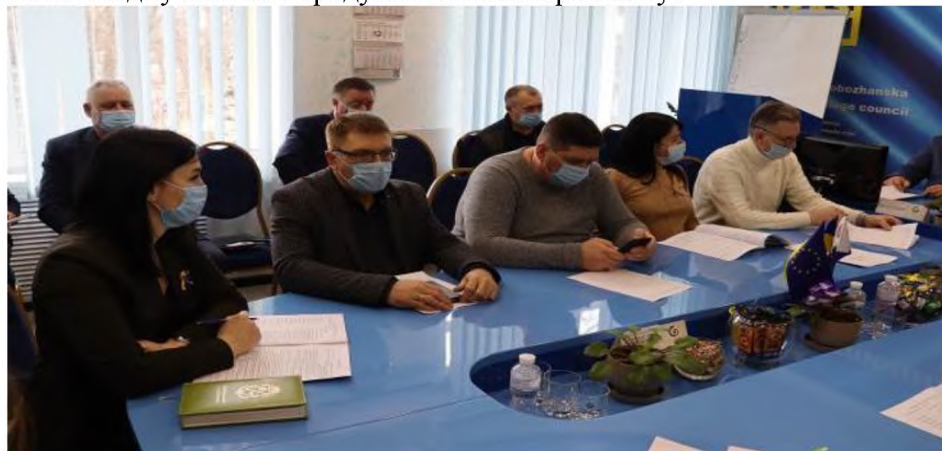
Під час засідання виконавчого комітету Слобожанської селищної ради

Я є членом виконавчого комітету Слобожанської селищної ради, де представляю інтереси жителів свого старостинського округу. Брав участь у всіх засіданнях виконавчого комітету, за винятком відпустки та передування на лікарняному.